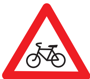
1.24. «Пересечение с велосипедной или велопешеходной дорожкой»