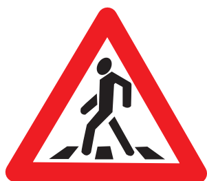
1.22 «Пешеходный переход»