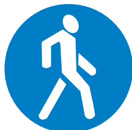
4.5.1. «Пешеходная дорожка»