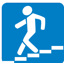
6.6. «Подземный пешеходный переход»