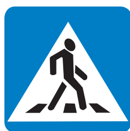
5.19.2 «Пешеходный переход»