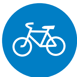
4.4.1. «Велосипедная дорожка»