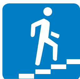
6.7. «Надземный пешеходный переход»