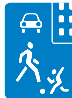
5.21. «Жилая зона»