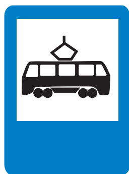
5.17. «Место остановки трамвая»