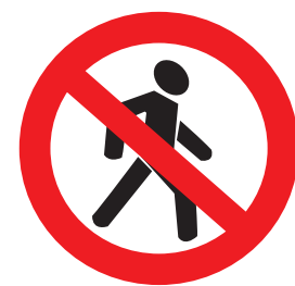
3.10. «Движение пешеходов запрещено»