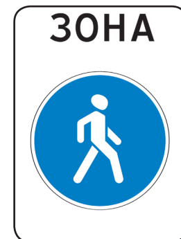
5.33 «Пешеходная зона»