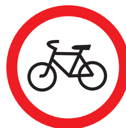
3.9. «Движение на велосипедах запрещено»